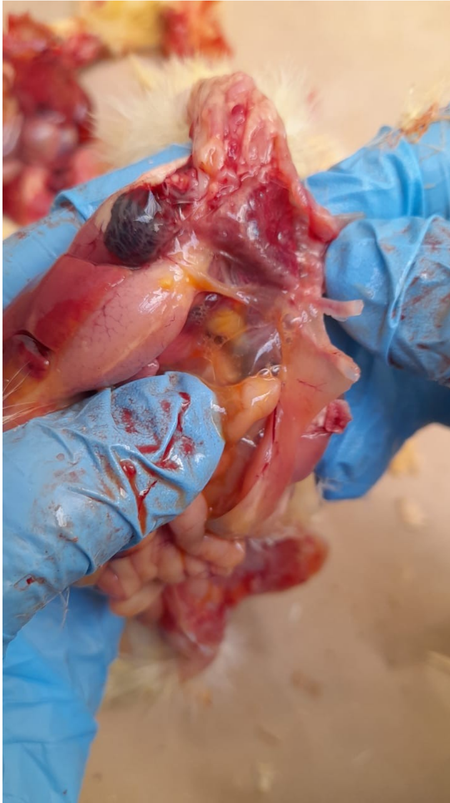
Рисунок 1 - Пенистое содержимое воздухоносных мешков DOI: https://doi.org/10.23670/IRJ.2023.137.94.1

Окончательно подтвердить диагноз можно только при бактериологическом и серологических исследованиях. Результаты серологического исследования сыворотки крови представлены в таблице 1.