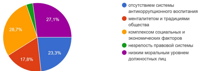
Рисунок 1 - Чем обусловлен высокий уровень коррупции в России? DOI: https://doi.org/10.23670/IRJ.2023.136.1.1

По мнению анкетированных, высокий уровень коррупции в России обусловлен низким моральным уровнем должностных лиц (27,1%), комплексом социальных и экономических факторов (28,7%) и другими причинами (рис. 1).