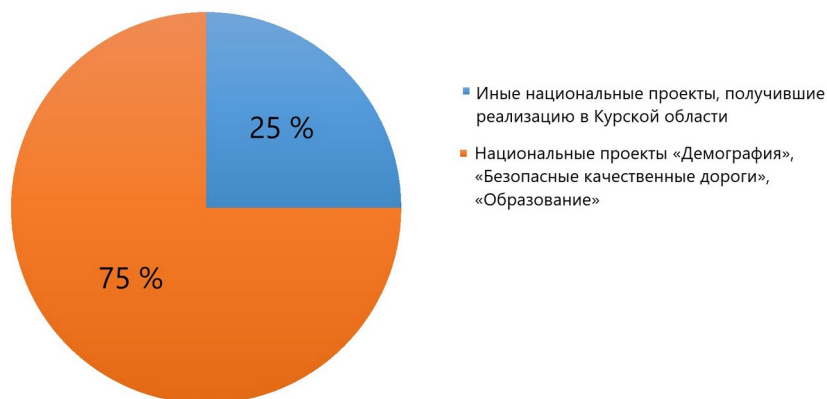
Рисунок 1 - Распределение средств на национальные проекты, реализуемые в Курской области в 2021 году DOI: https://doi.org/10.23670/IRJ.2023.130.75.1

Примечание: составлено авторами на основе данных [6]