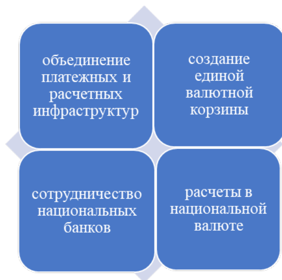
Рисунок 2 - Основные концепции развития ЕАЭС, ШОС и БРИКС в финансовой сфере DOI: https://doi.org/10.23670/IRJ.2023.129.59.2

ЕАЭС и БРИКС, в настоящий момент времени, нацелены на формирование единой финансовой структуры. Представим её в виде матрицы: (см. рисунок 2)