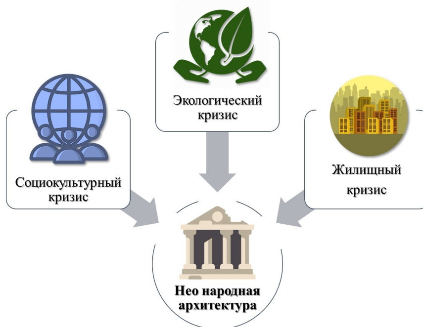
Рисунок 2 - Схема текущих проблем, приведших к появлению Нео-народной архитектуры

Примечание: по Willia-H. Sewell Jr, 1999, отредактировано автором