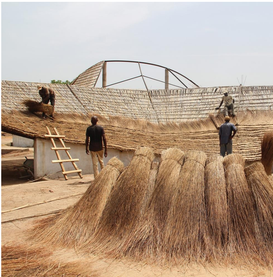
Рисунок 4 - Реализация крыши на основе растений, тростника и бамбука

Примечание: материал с ресурса designboom