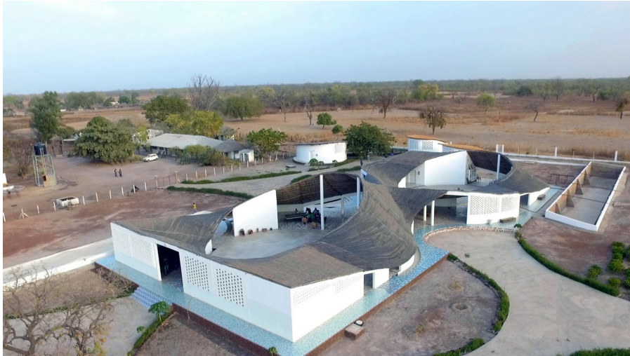
Рисунок 3 - Вид с воздуха - Отношение проекта к окружающей среде