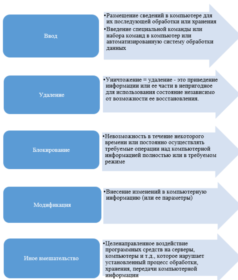
Рисунок 3 - Характеристика способов

Кроме того, необходимо отметить, что принципиальной особенностью мошенничества в сфере компьютерной информации выступает способ его совершения. Несмотря на то, что законодатель относительно ст. 159 6 не раскрыл характеристику способов совершения данного преступления, определения некоторых терминов можно обнаружить в методических рекомендациях по осуществлению прокурорского надзора за исполнением законов при расследовании преступлений в сфере компьютерной информации, в Постановлении Пленума Верховного Суда от 30.11.2017 № 48, а также доктрине уголовного права (см. рис. 3).