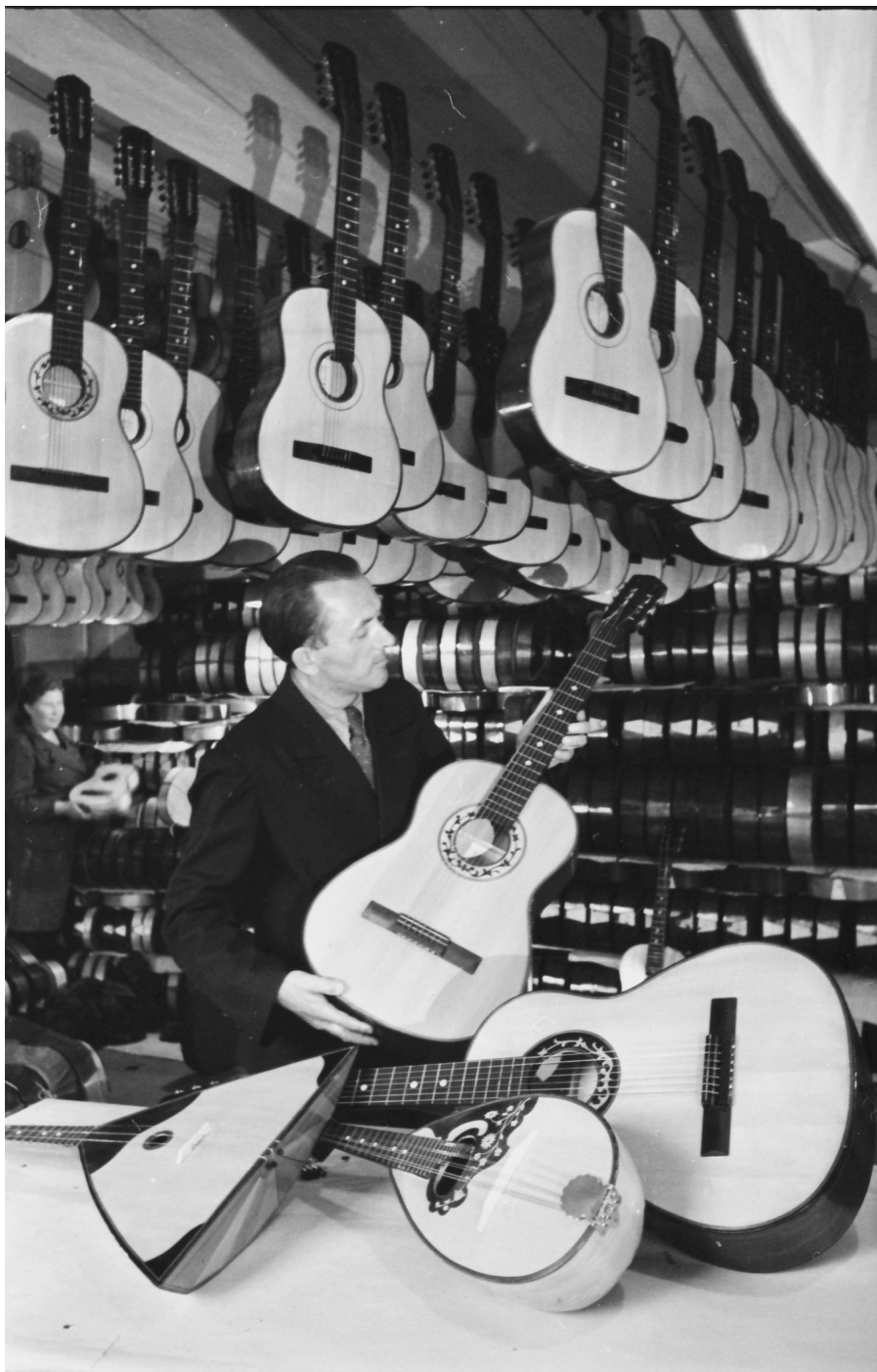
Рисунок 5 - Фабрика народных инструментов им. Луначарского. Ленинград 19.08.1949

DOI: https://doi.org/10.60797/IRJ.2026.168.20.5