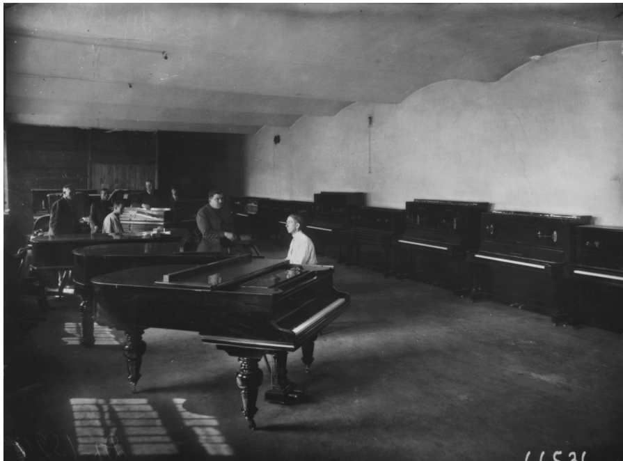
Рисунок 6 - Государственная фортепианная фабрика им. Луначарского (Вульфова, 15). Приемка роялей и пианино – продукции фабрики. Ленинград 1924

DOI: https://doi.org/10.60797/IRJ.2026.168.20.6