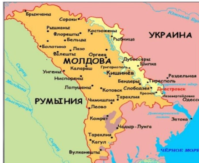
Рисунок 2 - Геополитическое положение Приднестровской Молдавской Республики на карте DOI: https://doi.org/10.60797/IRJ.2026.167.83.2

К экологическим угрозам относятся проблемы, касающиеся экосистем региона. Устойчивое развитие туризма осложняется недостаточным вниманием к охране окружающей среды и нарушениям в природных ресурсах. Отсутствие защиты и реабилитации экосистем может негативно сказаться на природной основе туристического предложения.