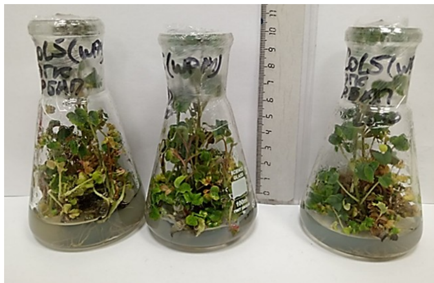
Рисунок 2 - Микрочеренки розы Circle of Life, прошедшие две фазы элонгации, на питательной среде WPM DOI: https://doi.org/10.60797/IRJ.2026.168.79.4

Примечание: ГК 3 0,5 мг/л + 6-БАП 0,05 мг/л / 6-БАП 0,05 мг/л