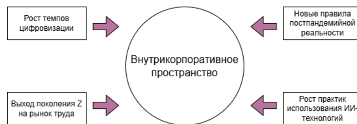
Рисунок 2 - Современные вызовы для внутрикорпоративного пространства DOI: https://doi.org/10.60797/IRJ.2026.167.41.4

Центральная идея лидерства, жидущегося на смыслообразовании, связана с достижением единого понимания во внутрикорпоративном пространстве, то есть насколько общий «социальный мир» организации разделяем её членами. Настоящее «искусство управления» начинается здесь — со способности лидера выявлять укоренившиеся смыслы, их поддерживать, изменять и создавать новые. В современных реалиях социально-трудовые отношения характеризуются растущими темпами цифровизации, правилами постпандемийной среды, выходом поколения Z на рынок труда и развитием практик использования ИИ-технологий (рис. 2).