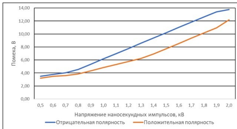
Рисунок 4 - Результат нейросетевого моделирования помех DOI: https://doi.org/10.60797/IRJ.2026.167.44.4

Результаты нейросетевого моделирования величины помех в ЭУ при воздействии по сети электропитания наносекундных импульсов в заданном диапазоне амплитуд, представлено на рис. 4.