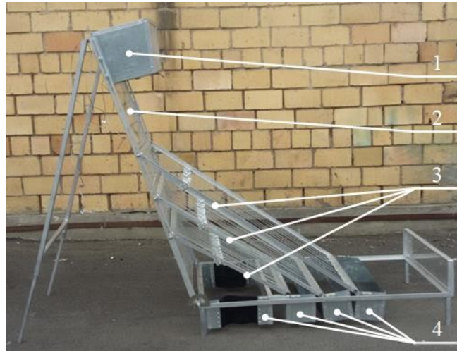
Рисунок 1 - Модель струнного грохота (вид сбоку)

В Сибирском федеральном университете разработаны модели струнного (СГ) и струнного ступенчатого (ССГ) грохотов для сортировки угля, защищенные патентами России [7], [8] отличающиеся простотой конструкций (рис. 1, 2).