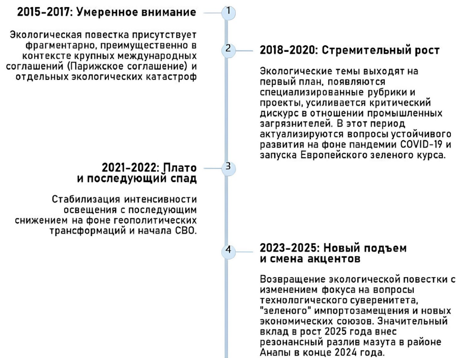
Рисунок 1 - Ключевые периоды трансформации экологического дискурса DOI: https://doi.org/10.60797/IRJ.2026.166.99.2

Анализ представленных данных позволяет выделить несколько этапов развития экологической медиаповестки. Период 2015–2017 гг. характеризуется умеренным ростом интереса к экологической тематике. В 2018–2020 гг. наблюдается резкое увеличение публикационной активности, связанное с усилением международной климатической повестки и активизацией обсуждения экологической ответственности бизнеса. В 2021–2022 гг. фиксируется снижение внимания к экологической проблематике, что связано с доминированием других макроэкономических и геополитических тем в медиапространстве. С 2023 г. наблюдается новый этап роста публикационной активности. Примечательно, что пики публикационной активности коррелируют с периодами обострения международной торговой конкуренции и трансформации глобальных производственных цепочек, что подтверждает гипотезу о связи экологического дискурса с геоэкономическими процессами (см. рис. 2).