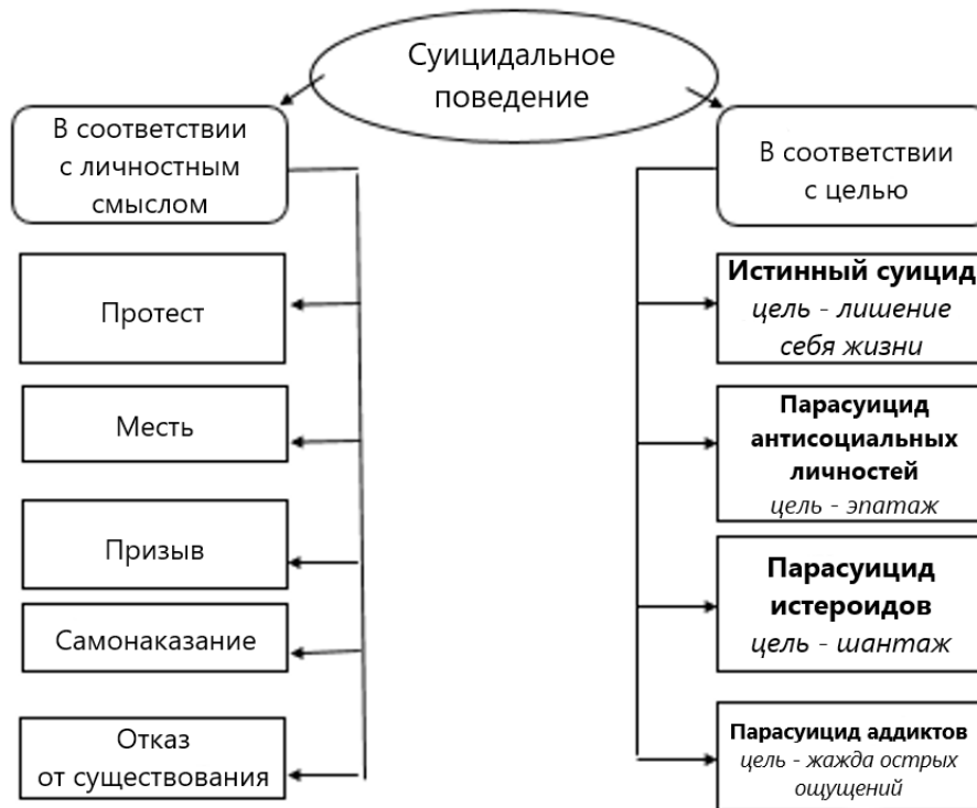
Рисунок 2 - Специфика и формы суицидального поведения в УИС DOI: https://doi.org/10.23670/IRJ.2022.125.66.2

Анализ специфики суицидального поведения в УИС позволяет условно подразделить суициды в соответствии с целью и личностным смыслом: