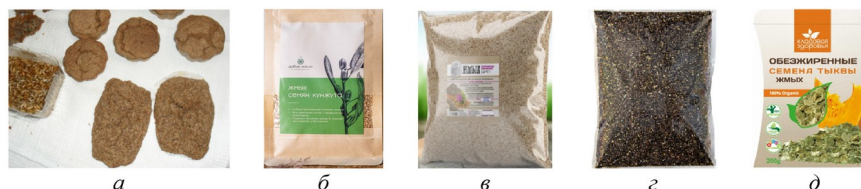
Рисунок 1 - Материалы исследования:

Материалом для исследования служили галеты, изготовленные из диспергированного ржаного солода, пророщенного по описанной методике [8], и молотых семян льна в соотношении 6:4. (рис. 1, а). Добавками для пищевой системы галет служили 4 вида сухого молотого жмыха (рис. 1, б...е), приобретённые на онлайн-платформе маркетплейса OZON.