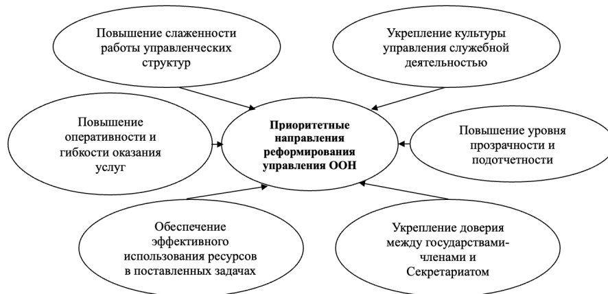
Рисунок 1 - Приоритетные направления реформирования управления ООН

Следовательно, реформа управления ООН ориентирована на оптимизацию процедур, а также на повышение [7] эффективности. Учитывая это, генеральный секретарь Антониу Гутерриш выделил шесть ключевых направлений для реформирования системы управления, представленных на рисунке 1.