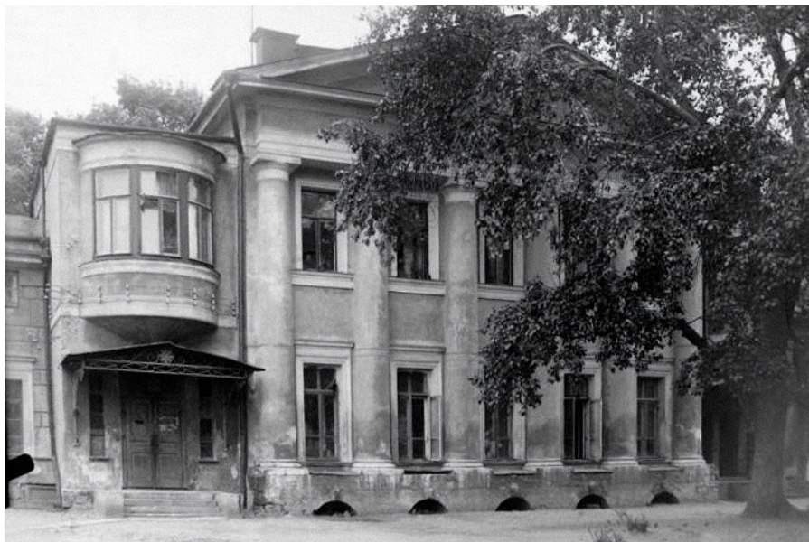
Рисунок 2 - Московский Союз художников, фото из архивов библиотеки МСХ

DOI: https://doi.org/10.60797/IRJ.2026.164.5.2