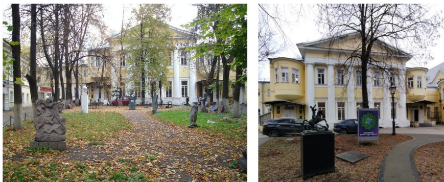
Рисунок 3 - Московский Союз художников, современное фото. Выставочные пространства в зонах парка в Старосадском переулке

Однозначно можно выделить множество факторов, которые в разной степени составляют основную концепцию творчества и создания произведения. Эта концепция рассматривалась на примере направлений и стилистических явлений в отечественной и зарубежной культурах. При этом объектом исследования может быть одно направление или отдельно взятое произведение, поскольку каждое из них представляет собой широкий спектр возможностей развития и становлении различных видов искусства. Роль связующего звена в этом процессе отводится творческим союзам и объединениям (см. рис. 3).