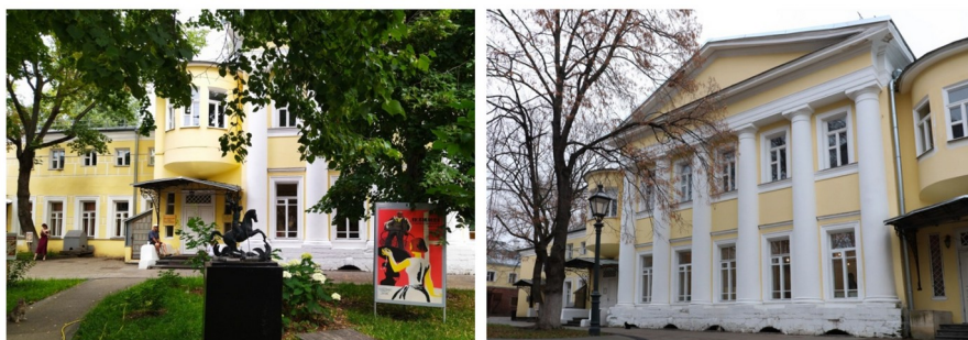
Рисунок 1 - Московский Союз художников, современное фото DOI: https://doi.org/10.60797/IRJ.2026.164.5.1

Проблематика данного исследования заключается в необходимости сохранения профессиональных учреждений и творческих объединений в современном социуме. Это позволяет выдвинуть гипотезу о том, что без достойной организации творческого процесса и обеспечения условий для работы художника решение профессиональных задач невозможно. Таким образом, цель данной статьи — изучение необходимых условий для творческого процесса и систематизации работы над художественным произведением [1], [2], [3].