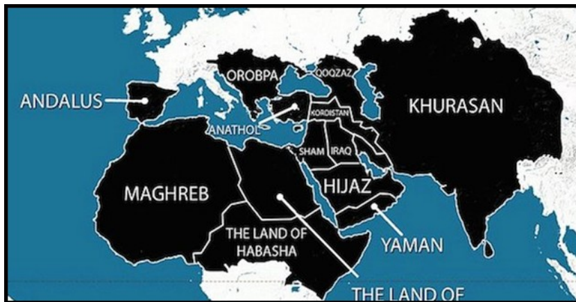
Рисунок 3 - Планы территориального роста ИГИЛ DOI: https://doi.org/10.23670/IRJ.2022.125.27.3