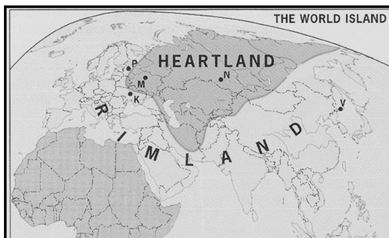
Рисунок 1 - Римленд

Первый сценарий «американский», получивший название «Римленда». Разработал его еще в 30-40е годы 20 века Н. Спайкмен [1]. Хотя выводы и заключение Спайкмена несколько и устарели на текущий момент, тем не менее, они свидетельствуют о чрезвычайно широком понимании им стратегических вопросов [2]. Автор предложил, опираясь на военную силу, применить метод «анаконды» для контроля и удушения береговых зон приморских стран Африки и Азии, включая Индию и Китай. (см. карту №1).