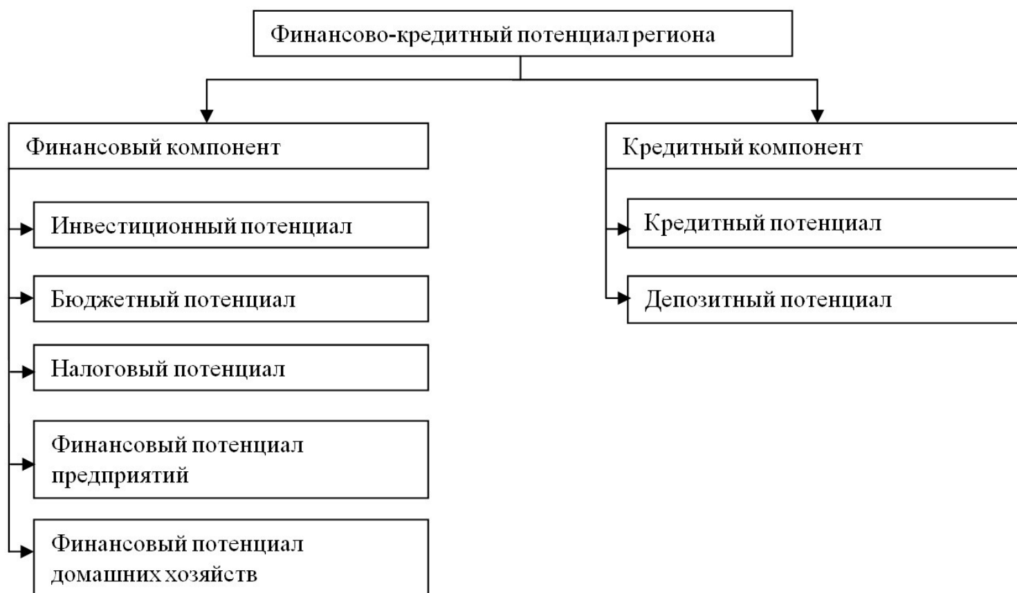
Рисунок 1 - Составляющие компоненты финансово-кредитного потенциала региона DOI: https://doi.org/10.23670/IRJ.2022.123.4.2