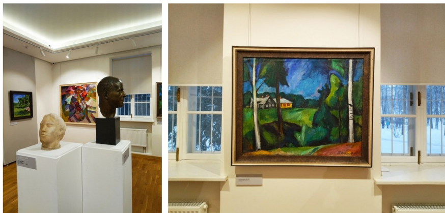
Рисунок 3 - Выставочные залы музея усадьбы «Абрамцево» DOI: https://doi.org/10.60797/IRJ.2025.152.28.3

Явлением XIX века становится русская усадьба, в которой на протяжении всего времени получает развитие школа изобразительного искусства. В этот период утверждается технологический процесс создания художественных произведений всех видов искусства. Особенность исторических школ ремесел и зарождение новых тенденций в искусстве, состояли в сохранении технологий. Определяется общая схема развития технологического процесса с распределением функций, создающих систему взаимодействия всех составляющих творческого процесса. См. (таблица 1).