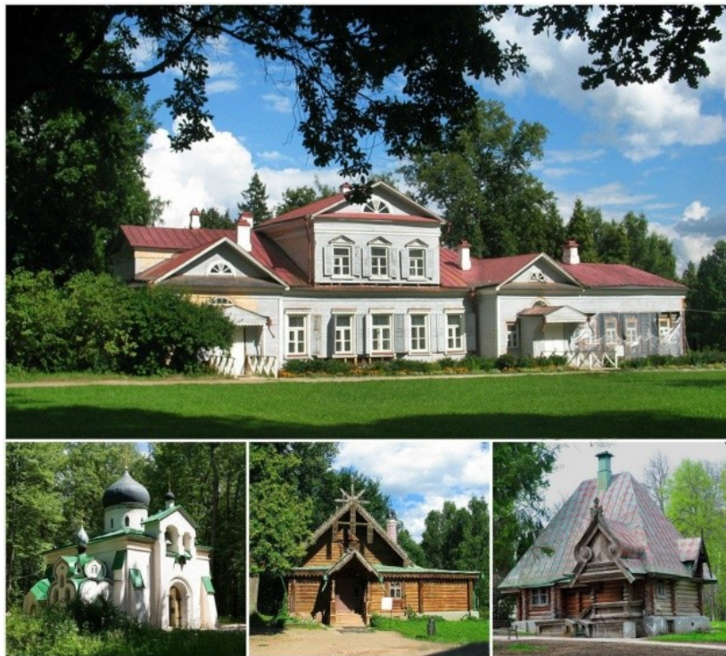
Рисунок 1 - Музей-усадьба «Абрамцево», современное фото DOI: https://doi.org/10.60797/IRJ.2025.152.28.1

национальной школы ремесел, проводился анализ на примере экспонатов музея-усадьбы «Абрамцево» (рис. 1.), (рис. 2.), и архивных и библиотечных фондов Москвы.