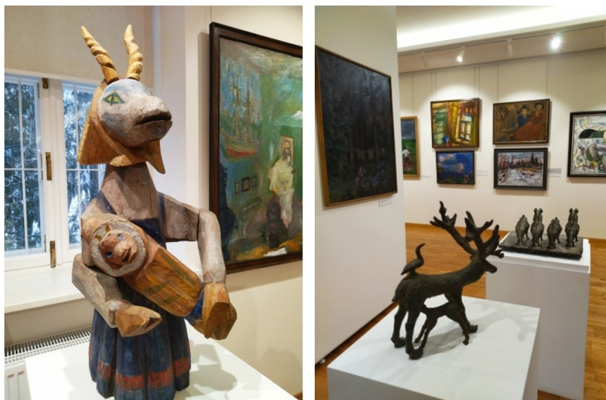
Рисунок 4 - Музейные комнаты и экспонаты музея усадьбы «Абрамцево» DOI: https://doi.org/10.60797/IRJ.2025.152.28.5

Деятельность русской усадьбы основывалась на организации художественных проектов, которые предоставили профессиональное становление большому количеству художников, композиторов, литераторов и драматургов. Уникальность такой продолжительной жизни русской усадьбы, сохранившей до наших дней свой функционал и систему развития, состоит в сохранении традиций многонациональных художественных промыслов России. Такое явление характерно для многих исторических центров, встречаются аналоги усадьбы «Абрамцево», следовательно, процесс технологических поисков становится закономерностью. Идея творческого содружества формируется в системе будущих Союзов художников, которые начинали своё существование в дворянской усадьбе (рис. 4) [14], [15].