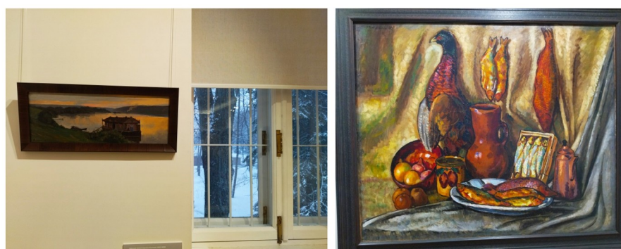
Рисунок 5 - Музейные экспонаты живописи усадьбы «Абрамцево» DOI: https://doi.org/10.60797/IRJ.2025.152.28.6

Примеры творческих союзов, которые были ядром создания художественных произведений, а также мастерских по живописи, обработке материалов и многих других технологических процессов известны во всем мире. В XIX веке таким местом была Франция, сохранившая в современности множество художественных центров, которые стали Домом-музеем, примером является Дом-музей Клода Моне в Живерни [16], [17].