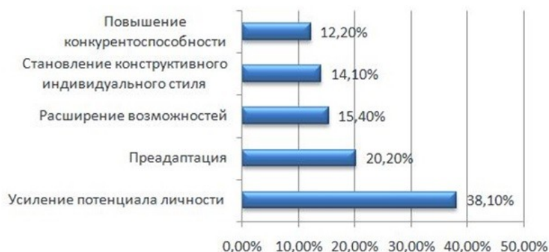
Рисунок 2 - Функции преобразующей активности DOI: https://doi.org/10.60797/IRJ.2024.150.156.2

В результате обобщения результатов анкетирования можно констатировать, что в представлениях студентов, участвующих в исследовании, преобразующая активность наделяется целым рядом функций, в обобщенном виде их можно представить следующим образом: «усиление потенциала личности» (38%), «преадаптация» (21%), «расширение возможностей» (15%), «становление конструктивного индивидуального стиля» (14%), «повышение конкурентоспособности» (12%) (рис. 2.).