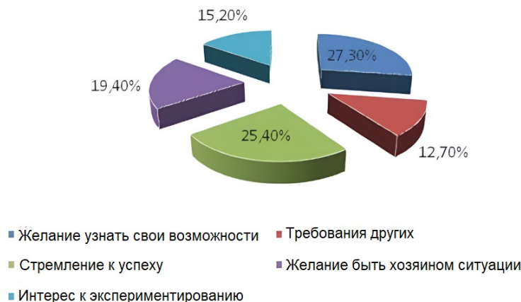
Рисунок 1 - Мотивация преобразующей активности DOI: https://doi.org/10.60797/IRJ.2024.150.156.1

Интересно, что достаточно большая часть студентов (43%) признает значимость трансформаций сегодня для достижения успеха на жизненном пути в будущем, вместе с тем, часть респондентов (28%) сомневаются в том, что постоянные преобразования своего поведения имеют смысл, считают, что это противоречит устойчивости личности и еще одна группа (19%) подчеркивает, что такие изменения оправданы, когда это необходимое требование для достижения цели.