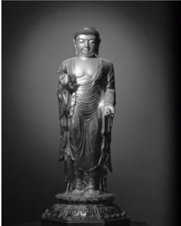
Рисунок 1 - Статуя Будды Шаолиньвона, 1935 г. DOI: https://doi.org/10.60797/IRJ.2024.149.4.1