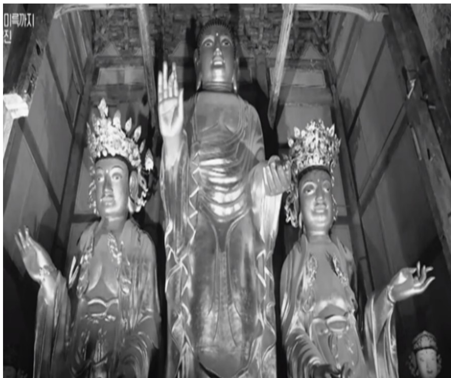
Рисунок 2 - Главная статуя зала Майтреи, 1936 г. DOI: https://doi.org/10.60797/IRJ.2024.149.4.2