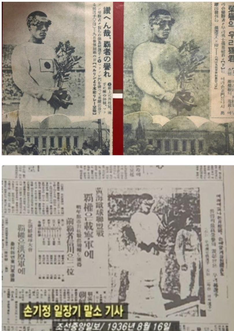
Рисунок 3 - Газета «Чосон Чунъанъ ильбо» с удалением японского флага DOI: https://doi.org/10.60797/IRJ.2024.149.4.3