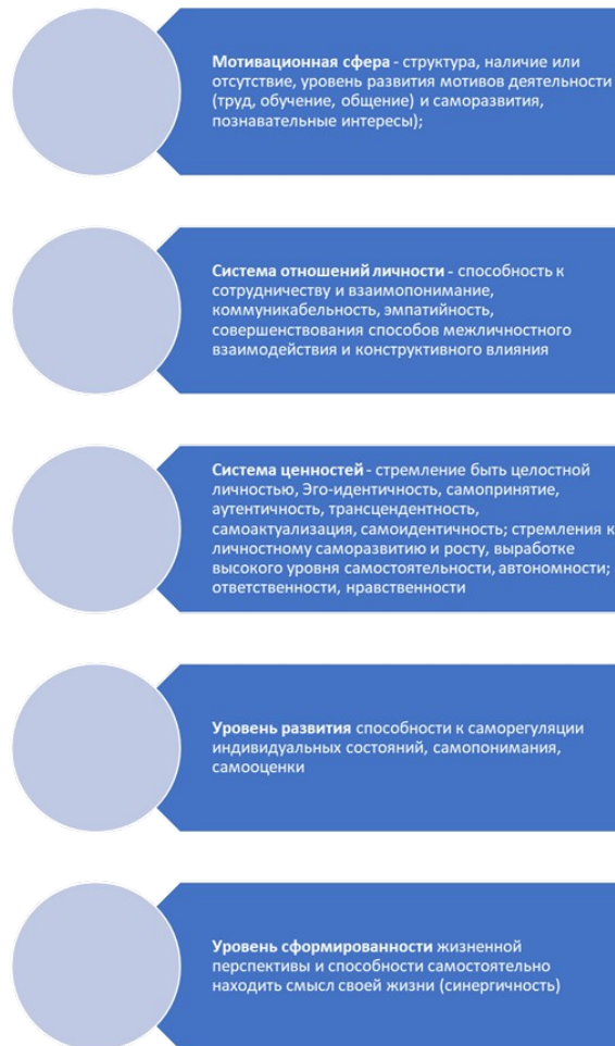
Рисунок 1 - Потенциальные основания дифференциации мотивационно-ценностного компонента личностной зрелости DOI: https://doi.org/10.23670/IRJ.2022.122.104.1

Этапами развития мотивационно-ценностного компонента личностной зрелости выступают следующие: самопознающий, самооценочный и самокорректирующий . В этих этапах нельзя выстроить очередность, они взаимосвязаны между собой, так как самопознание проходит постоянно через самооценку, а самокоррекция через самопознание и самооценку. И, наоборот, самооценка не может идти не через самопознание (рис.2).