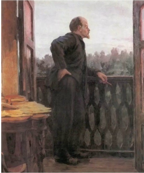
Рисунок 5 - В.И. Ленин в Подольске DOI: https://doi.org/10.60797/IRJ.2024.143.136.5