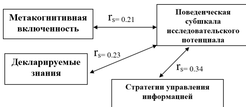
Рисунок 3 - Корреляционная плеяда взаимосвязи переменных «метакогнитивная включенность» и субшкалы исследовательского потенциала

Выделим корреляты между метакогнитивной включенностью и компонентами исследовательского потенциала субъекта (рис. 3).