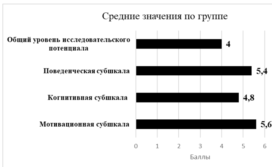
Рисунок 2 - Усредненные значения по методике «Исследовательский потенциал студента» DOI: https://doi.org/10.60797/IRJ.2024.143.58.2