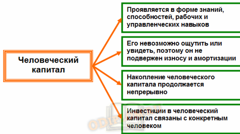
Рисунок 1 - Понятие человеческого капитала [3] DOI: https://doi.org/10.23670/IRJ.2023.136.46.1