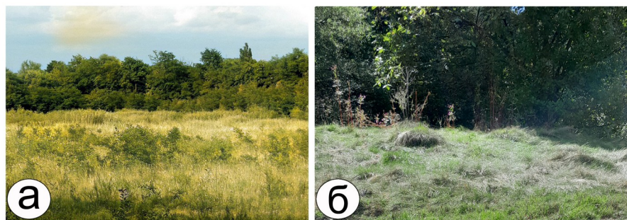
Рисунок 4 - Местообитания Медведицы красноточечной Utetheisa pulchella L.: а — в районе Водной станции (1985), б — в Комсомольском лесопарке (2022) DOI: https://doi.org/10.23670/IRJ.2023.132.63.4