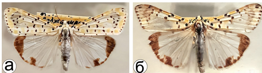
Рисунок 1 - Медведица красноточечная ( Utetheisa pulchella L.) из коллекции НМ РСО-А: а, б — самцы DOI: https://doi.org/10.23670/IRJ.2023.132.63.1