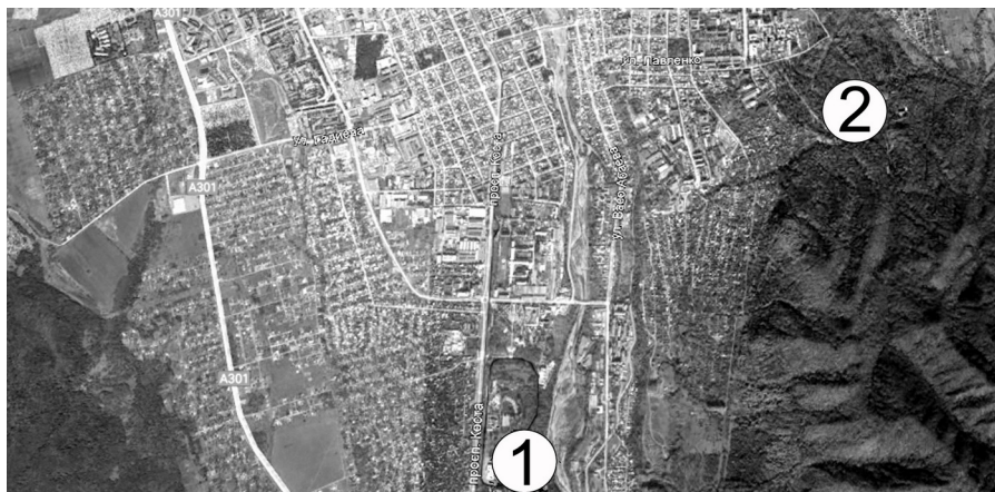
Рисунок 2 - Места проведения регулярных визуальных наблюдений в окр. Владикавказа DOI: https://doi.org/10.23670/IRJ.2023.132.63.2

двухдневных маршрутных наблюдений. Ежегодно, с периодичностью один раз в неделю с марта по ноябрь нами проводились визуальные наблюдения в районе Водной станции, на разнотравно-злаковом лугу, где были собраны коллекционные экземпляры (ВШБ, НМ РСО-А) и в предгорьях Лесистого хребта в Комсомольском лесопарке (Рисунок 2). Эти две географические точки, на протяжении всего периода проведения наших исследований, являлись стационарными пунктами наблюдений.