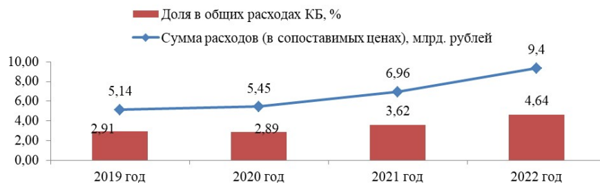
Рисунок 1 - Расходы (плановые) на развитие сельских территорий по всем ГП и доля в общих расходах КБ DOI: https://doi.org/10.23670/IRJ.2023.136.3.1

Как показывают представленные сведения, за обозначенный период объем средств увеличился более чем в два раза (с 5,14 до 9,4 млрд. рублей или на 182%). Доля затрат на развитие сельских территорий в расходах краевого бюджета выросла с 2,9% до 4,64% или на 173 базисных пункта. Динамика положительная и свидетельствует не только об увеличении уровня финансирования, но и смещении акцентов в региональной политике в отношении села.