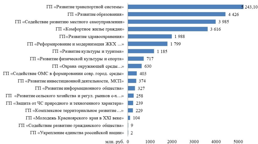
Рисунок 2 - Плановые расходы краевого бюджета на развитие сельских территорий по отдельным государственным программам за 2020-2022 годы DOI: https://doi.org/10.23670/IRJ.2023.136.3.2

В регионе до 2022 года реализовывалось 18 государственных программ, в рамках которых были заложены средства, в том числе, и на сельские территории. В 2022 году стартовала реализация программы «Комплексное развитие территорий Красноярского края». На рисунке 2 приведены данные о распределении средств между программами, которые позволяют оценить приоритетность направлений в сельской местности.