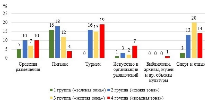
Рисунок 2 - Количественный состав предприятий туризма, гостеприимства, культуры и спорта по группам («зонам») DOI: https://doi.org/10.60797/IRJ.2024.143.69.2

Далее по количеству вошедших предприятий идет 3 группа или «желтая зона» – 56 ед. или 28%. При этом из 56 предприятий 12,5% – это средства размещения; 21% – предприятия питания; 27% – предприятия туризма; 3,5% – предприятия искусства и организации развлечений; 36% – предприятия спорта и отдыха.