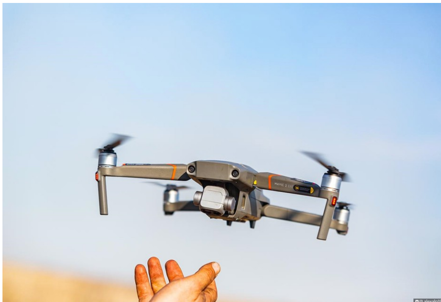
Рисунок 1 - Квадрокоптер для первого типа использования DOI: https://doi.org/10.60797/IRJ.2024.143.15.1

При тушении крупных пожаров в лесостепной зоне Камышловского лесничества стало понятно, что дрон должен быть устойчив к ветру, выдерживать его порывы до 10 м/с, желательна защита от влаги, кроме того, данный тип БПЛА должен иметь возможность летать в тумане и небольшом дожде, а также оборудован 12-мегапиксельной камерой с зумом, поддерживающей 8-кратное оптическое увеличение.