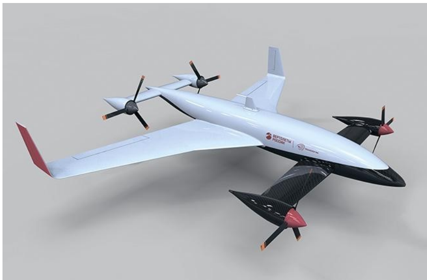
Рисунок 3 - Внешний вид конвертоплана DOI: https://doi.org/10.60797/IRJ.2024.143.15.3

Также перспективным направлением использования конвертопланов является использование дронопортов, они представляют собой автономные станции, предназначенные для базирования взлета и посадки дронов. Такие станции включают в себя взлетно-посадочные полосы, метеостанции, энергетические станции, пункты маршрутизации.